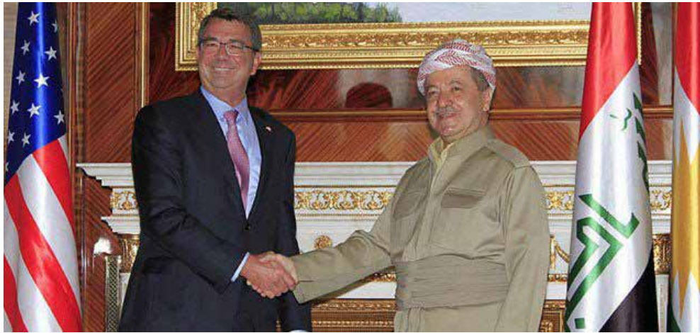
ناوچه‌که له‌قه‌لم دا».

له‌ درێژه‌ی قسه‌کانیدا بارزانی رو‌شنایی خسته‌ سه‌ر شه‌ری «تیرۆریستان» و جه‌ختی له‌وه‌ کرده‌وه‌ که «بۆ ئیمه‌ جیگه‌ی شانازییه‌ پێشمه‌رگه‌ به‌ نوپه‌رایه‌تی جیهان شه‌ری تیرۆر ده‌کات و له‌گه‌ڵ ئەوه‌یش ئەو شه‌ره‌ ته‌نیا شه‌ری لایه‌نیک نییه‌ له‌گه‌ڵ تیرۆر، به‌لکو شه‌ری هه‌موو لایه‌که، بۆیه‌ به‌ کاری هاوبه‌ش و پیکه‌وه‌یی ده‌کری ئەنجام و سه‌رکه‌وتی زۆر باش به‌ده‌ست به‌یت».