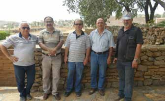
برزاني في عمليات الأنفال السيئة الصيت.

زار وفد من منظمة سورايا للثقافة والإعلام منطقة بارزان وإطلع على المواقع الأثرية والتاريخية في المنطقة كما زار قرية بارزان التي تعرضت للحرق والتدمير عدة مرات على أيدي الحكومات العراقية المتعاقبة، وزار الوفد أيضا ضريح الخالدين الملا مصطفى بارزاني وإبنة القائد ادريس بارزاني وفاء للنضال البطولي لهذه العائلة التي راح منها أكثر من (٨) آلاف