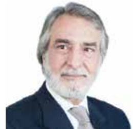
باحث أكاديمي وسياسي عراقي مقيم في لندن